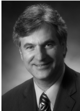
Jean-Marc Fournier Leader parlementaire du gouvernement et ministre responsable de la Réforme parlementaire